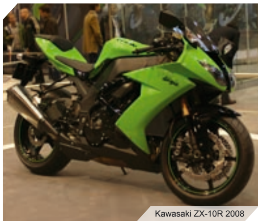
Kawasaki ZX-10R 2008