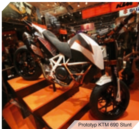
Prototyp KTM 690 Stunt