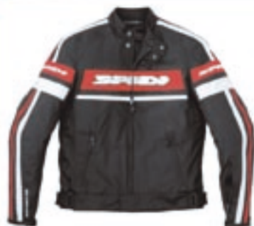
Bundy Spidi, Bering