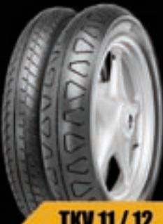
TKV 11 / 12