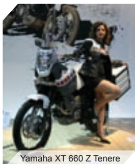
Yamaha XT 660 Z Tenere