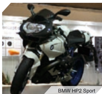
BMW HP2 Sport