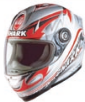
Prilby Shark, Axo