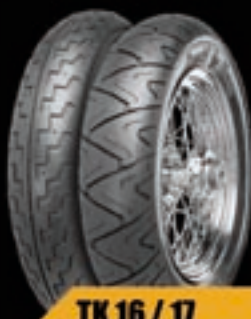
TK 16 / 17