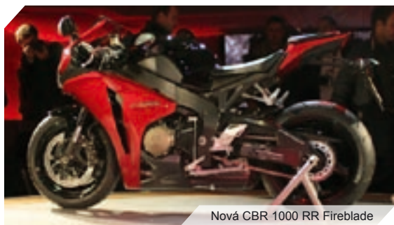
Nová CBR 1000 RR Fireblade