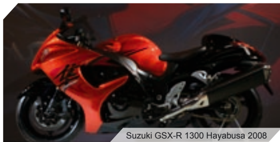
Suzuki GSX-R 1300 Hayabusa 2008