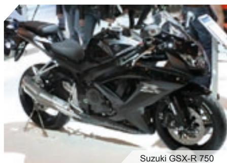
Suzuki GSX-R 750