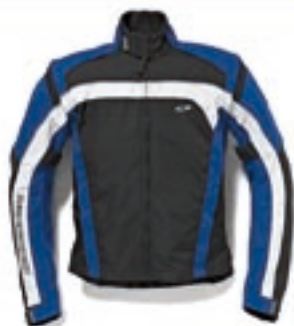
Bundy Axo, Dainese